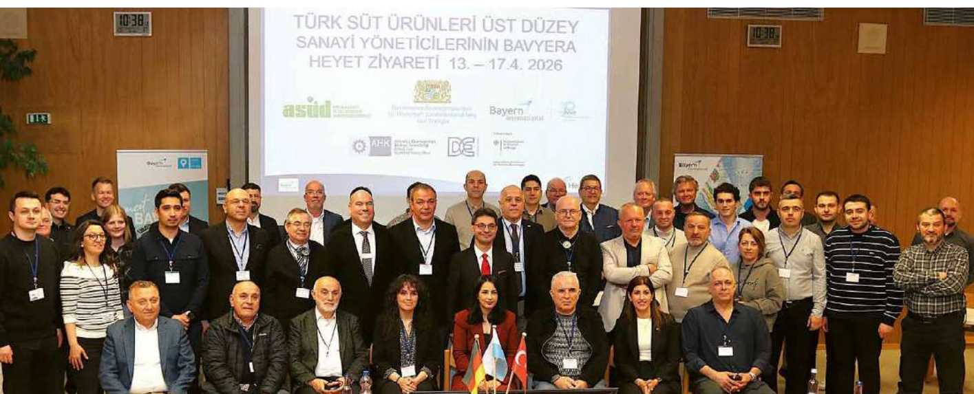
Die Teilnehmer der Delegationsreise im großen Hörsaal des Lehr-, Versuchs- und Fachzentrums für Molkereiwirtschaft Kempten.

Am Montag, 13. April 2026 landeten am Flughafen Franz-Josef Strauß in München 29 Teilnehmer einer Delegationsreise von Führungskräften der Molkereiindustrie aus der Türkei nach Bayern. Solche Delegationsreisen werden veranstaltet von der Bayern International – Bayerische Internationale Wirtschaftsbeziehungen GmbH. Dies geschieht im Rahmen des internationalen Fort- und Weiterbildungsprogramms zur Exportförderung – »Bayern – Fit for Partnership« (BFP).